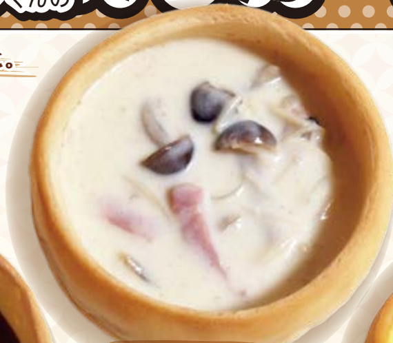
白のきのこのクリームスープ