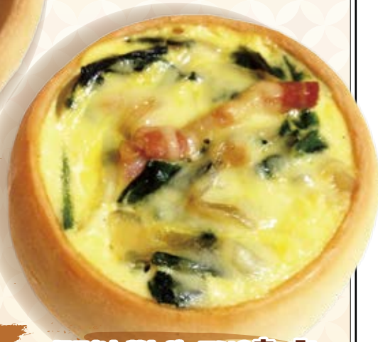
ほうれん草とベーコンのキッシュ